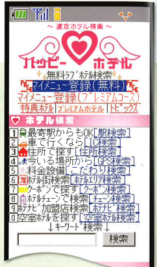
トップページ。 有料会員はお得かつ便利な新コンテンツが利用できる

レジャーホテルの検索サイト「ハッピー・ホテル」が2009年12月、NTTドコモ、au、ソフトバンクの携帯大手3社の公式サイトとして大幅にリニューアルする。リニューアル直前にハッピー・ホテルを開発・運営するUSENグループのアイメディアに話を聞いた。