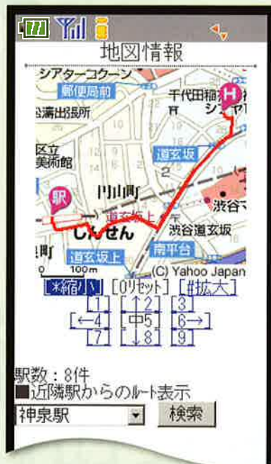
最寄り駅等からホテルまでの 「ルート案内」表示