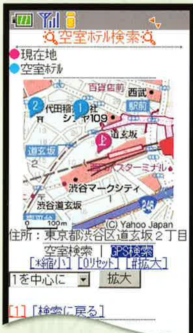
現在地からの「空室ホテル検索」機能